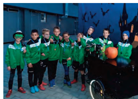
ESE U11 • I. Halloween Football Cup