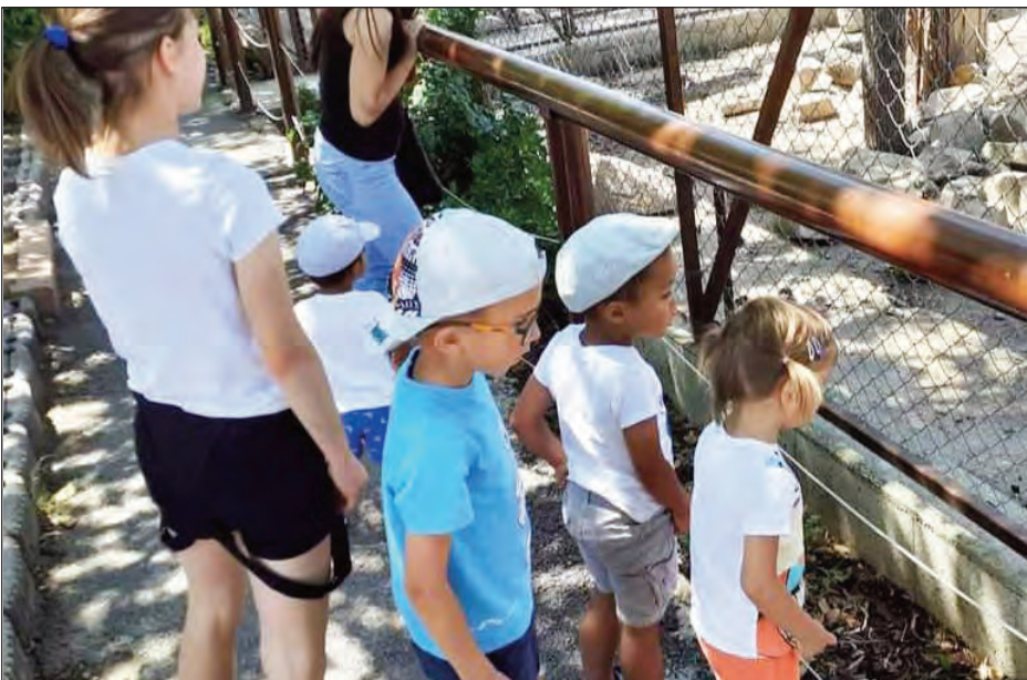
Medveotthonban a család

Én nagycsaládból származom, igaz, hogy mozaikcsaládból, de négyen vagyunk testvérek. Nálunk otthon is meg volt osztva a házimunka, mindenkinek megvolt a feladata. Ez jó minta volt számomra, most sincs másképp. Például mindenki elteszi maga a ruháját, van, aki a mosógépet szokta bepakolni, más a főzésben, zöldségfőzvényben, előkészítésben segít. Alapvetően az önállóságra neveljük a gyerekeket, hogy egyedül is álljanak neki a dolgukat végezni, tanulni.