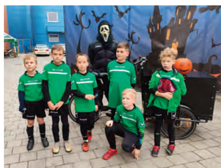
ESE U9 • I. Halloween Football Cup