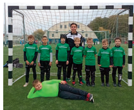
ESE U9 • Football Factor Kupa, Fót