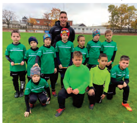
Erdőkertesi SE U9 • Bozsik-fesztivál