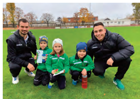
Erdőkertesi SE U7 • Bozsik-fesztivál