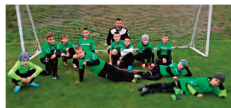
ESE U11 • Veresegyház edzőmérkőzés