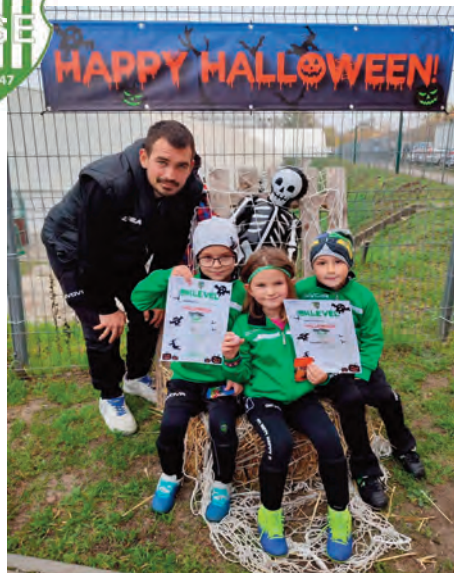
ESE U7 • I. Halloween Football Cup