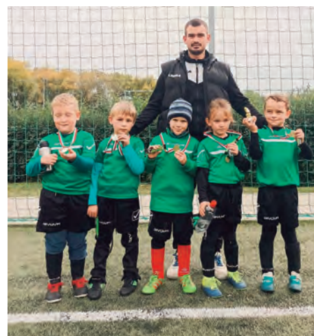
Erdőkertesi SE U7 • Október 23. Kupa, Göd