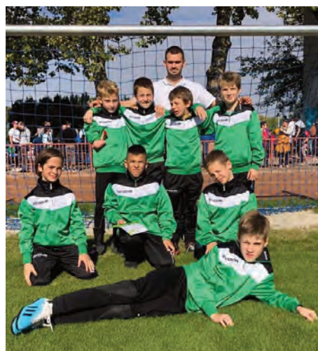
Erdőkertesi SE U11 • Bozsik-fesztivál