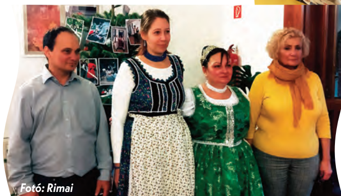
A Mini-kalácsverseny győztesei