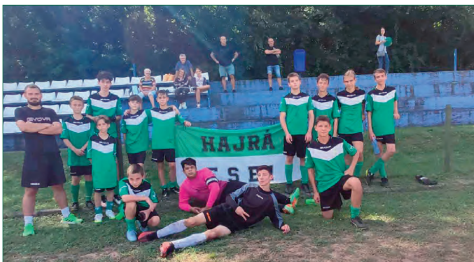
Erdőkertesi SE U15 • Gödi SE – Erdőkertes SE