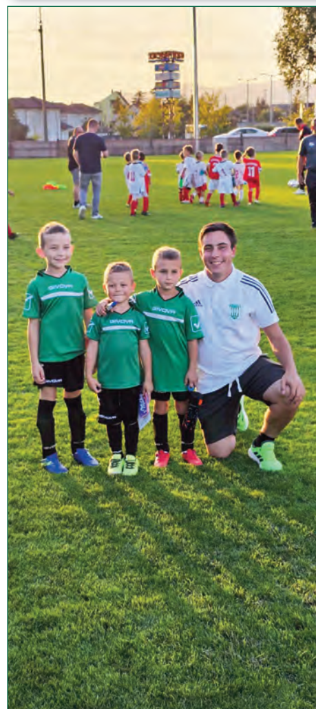
Erdőkertesi SE U7 • Bozsik-fesztivál