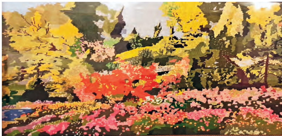
Tájkép című gobelin