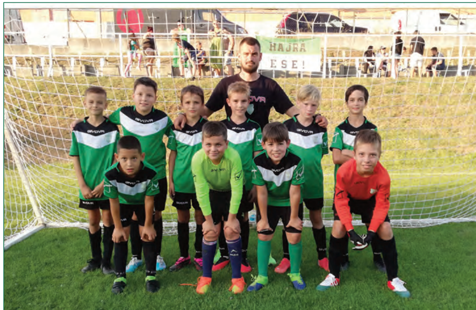
Erdőkertesi SE U11 • Edzőmérkőzés, Veresegyház

nyeket és helyenként jó focit játszva lép pályára hétről hétre. Legnagyobb korosztályunk számára sajnos kevesebb sikerélmény jutott eddig a szezonban. Az egyébként sem túl bő keretünk közül több játékos idény közben jelentette be, hogy nem szeretné folytatni a labdarúgást, ami nem könnyíti meg a helyzetet. Ettől függetlenül dolgoznak becsülettel a srácok, és a befektetett munkának mindig megvan az eredménye. A visszajelzések mind pozitívak, több „rég motoros” elmondása alapján nem volt még ennyi gyerek az erdőkertesi pályán, mint napjainkban. Ezek számunkra mind jóleső visszajelzések, hogy jó az út, amin járunk. De sosem elégszünk meg, mindig van feljebb!