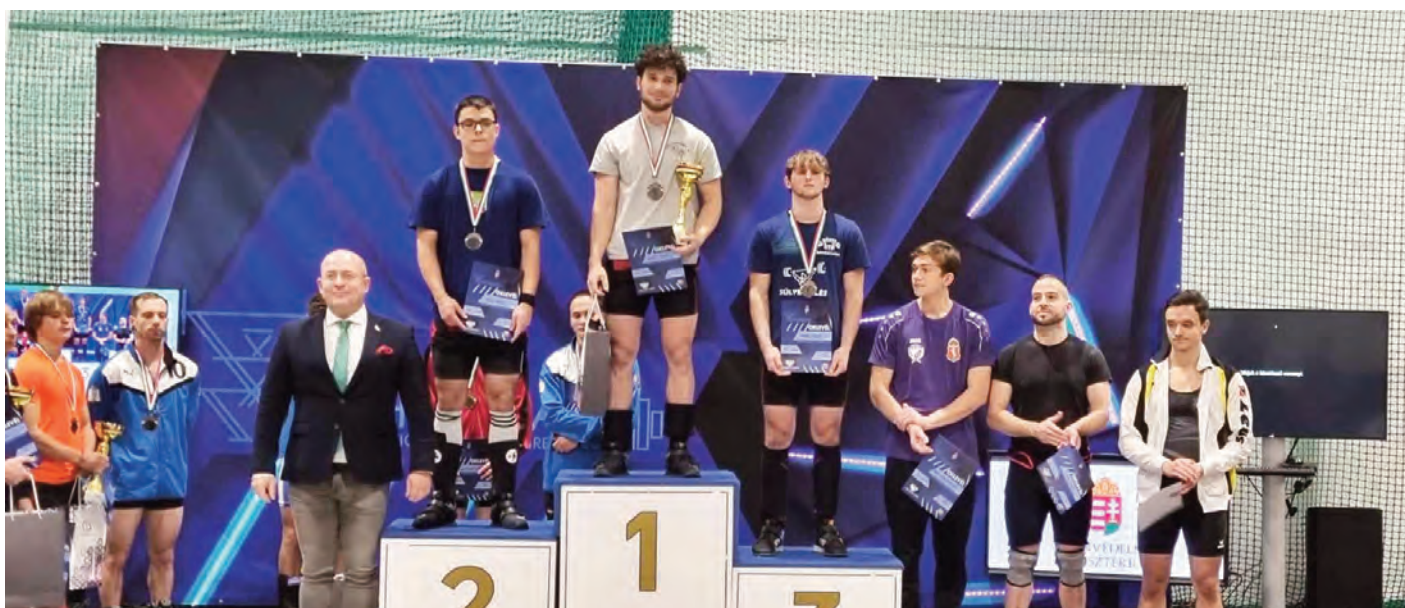
Felnőtt OB (73 kg) I. helyezés – 2023. november 18-19., Nyíregyháza