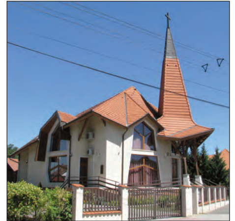
Élő Reménység Baptista Imaház Veresegyházon

„Bármilyen legyen is házasságunk jelenlegi minősége, mindig van mit tennünk azért, hogy jobbá váljon.” (Gary Chapman)