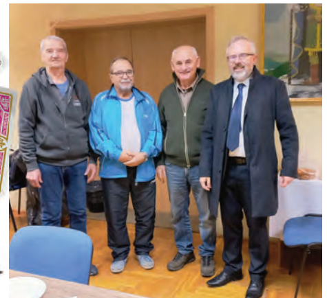
A nyertesek a polgármesterrel