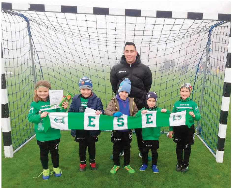
Erdőkertesi SE U7 • Bozsik-fesztivál