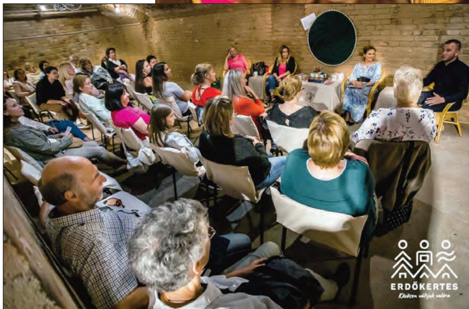
A vendégek és a hallgatóság