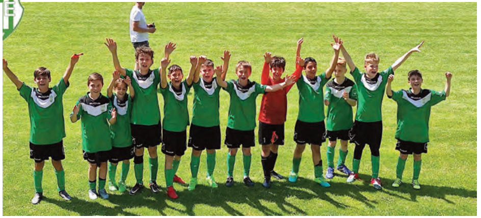
Erdőkertesi SE U13 • Erdőkertesi SE – Göd (05. 21.)