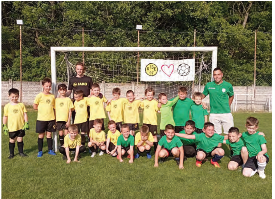
Erdőkertesi SE U9 • Edzőmérkőzés