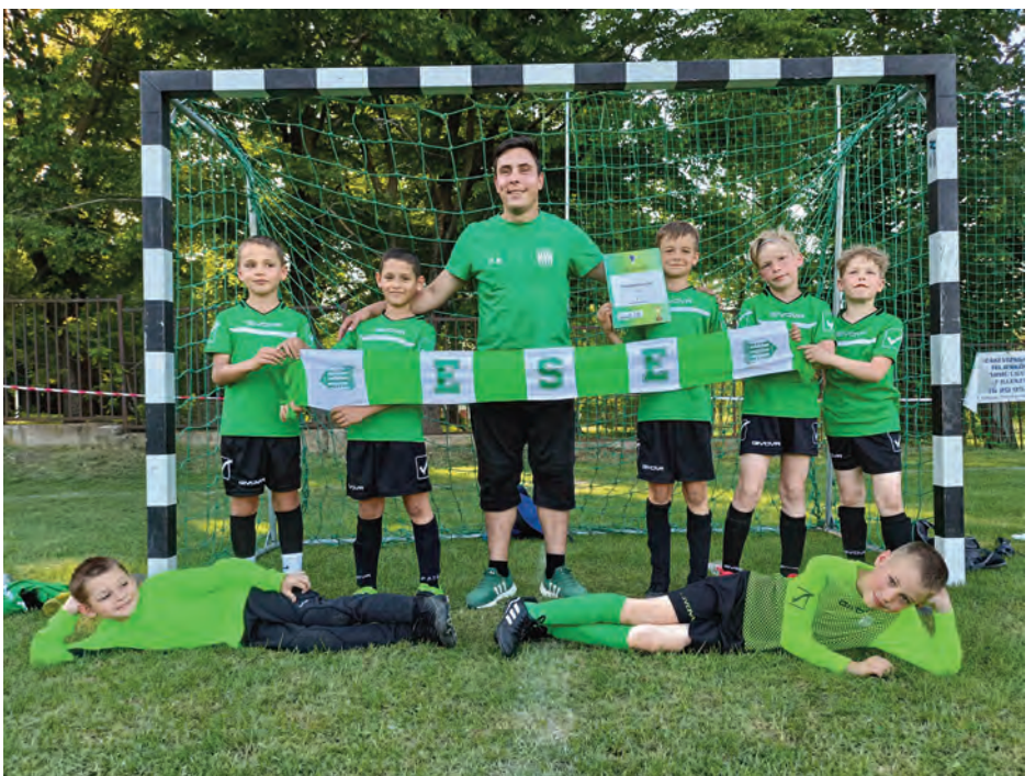
Erdőkertesi SE U9 • VöViK Champions Cup (05. 21.)