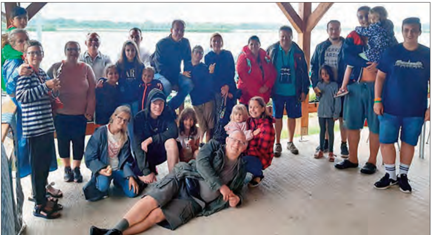
Kirándul a Házaspáros közösség