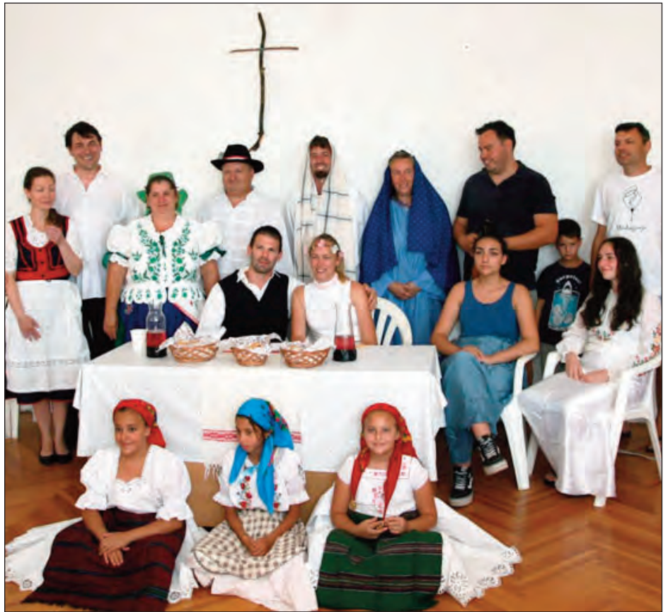
A kánai menyegző előadói a Házaspáros közösségből

zösség alakuló alkalmára), nagyon megörül-tünk. Nekünk az elejétől fontos volt, hogy ami-ben lehet, segítsünk.