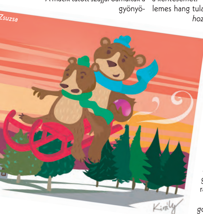
Illusztráció: Király Zsuzsa

A macik tátott szájjal bámulták a gyönyörűen kivilágított Szent István-parkot, benne a hatalmas, hólepte adventi koszorúval, meglesték Téalapó szobácskáját, és a karácsonyról megmaradt szelfipontot, a Faluházat, a Hivatalt, az óvodákat és a sulit, aztán hasítottak egyre kijebb és kijebb, buszmegállókon és buszfordulókon keresztül, Szentsaroktól a Háromház parkig és vissza. Nem győztek álmélkodni, milyen szépséges tájra vezette őket a varázsgömb, és a szánkós városnéző körút csak hab volt a mézes málnás torta tetején.