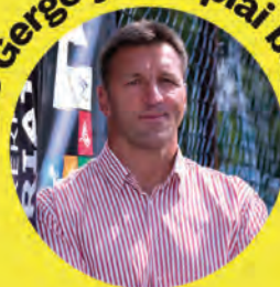
Kiss Gergely olimpiai bajnok