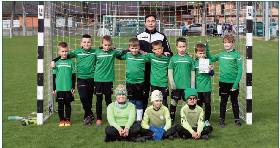
Erdőkertes SE U9 Bozsik fesztivál – 2024. 03. 09.