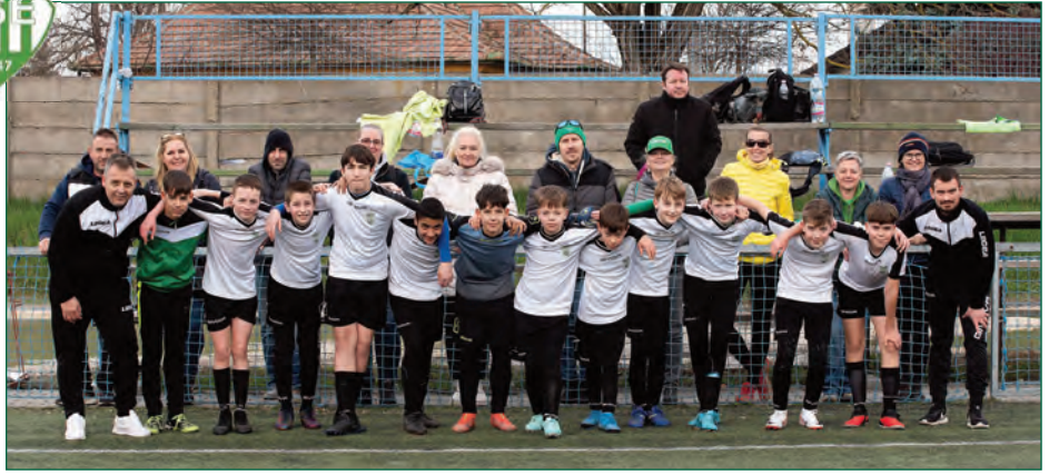
Erdőkertes SE U13 – Kerepes, 2024. 03. 10.

03. 25. Mogyoródi KSK – Erdőkertesi SE 1:6