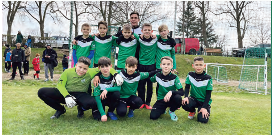
Erdőkertes SE U11 Bozsik torna – 2024. 03. 10.