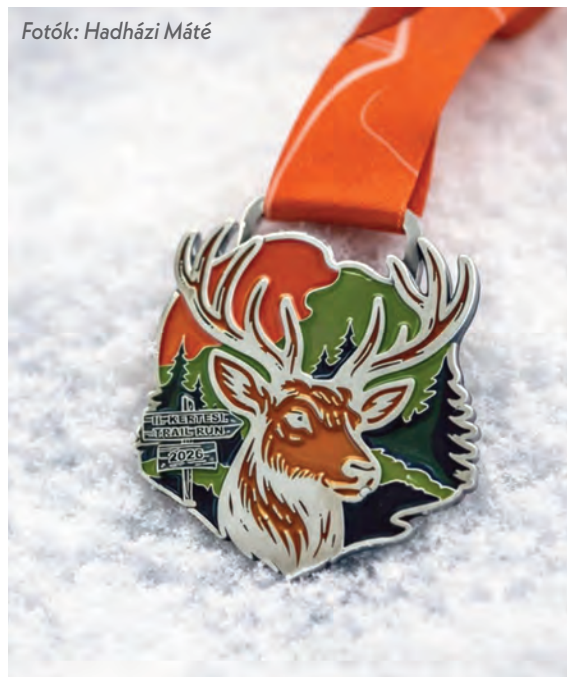
II. Kertesi Trail Run érme