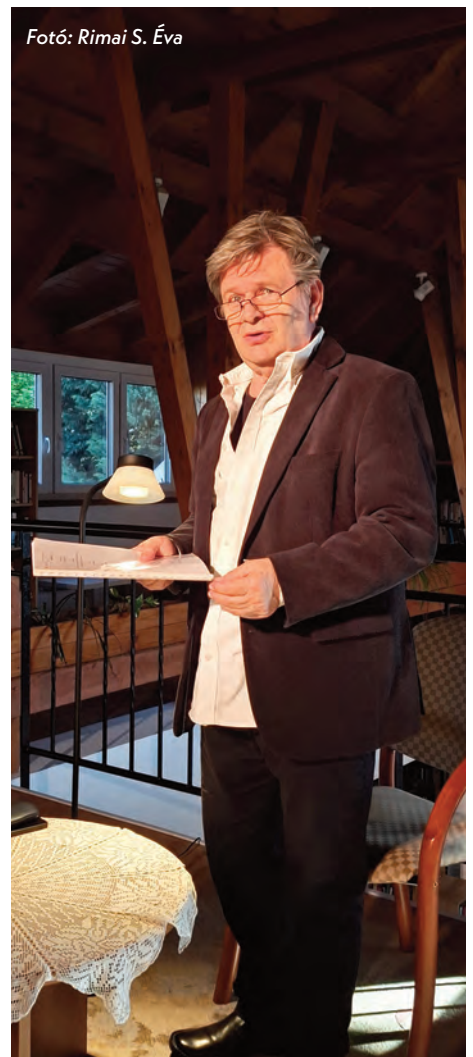
Gyabronka József színművész